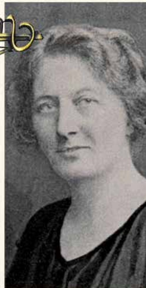
Ada English thart ar 1910