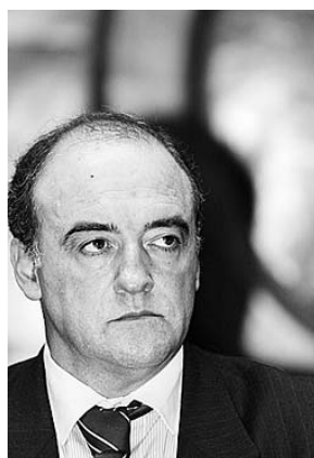
Miguel Beleza, economista do BCP e ex-governador do Banco de Portugal.

■ Miguel Beleza, economista do BCP e um dos arquitectos da entrada de Portugal na União Económica e Monetária, sublinhou ao DE que antes da adesão à moeda única "já se sabia que iria haver uma corrida ao crédito e que o endividamento dos particulares iria disparar" porque o mercado de capitais estava finalmente liberalizado, na sequência da assinatura do Tratado de Maastricht. "Até podemos argumentar que o Banco de Portugal poderia aplicado regras mais apertadas na concessão de crédito e evitar o 'boom', mas se não fossem os bancos nacionais a emprestar seriam os estrangeiros", explica o ex-governador da autoridade monetária. Beleza leu o estudo do Bruegel e concorda que este mostra que Portugal foi o país que mais perdeu com a entrada no euro, mas defende de imediato que a má 'performance' da economia está directamente relacionada com as políticas económicas "erradas" que entretanto foram seguidas, sobretudo a orçamental. "Foram as piores possíveis", acusa o ex-ministro das Finanças. "Há também o argumento de que nos fundos estruturais foram mal aplicados, que inundaram a economia de dinheiro fácil e que